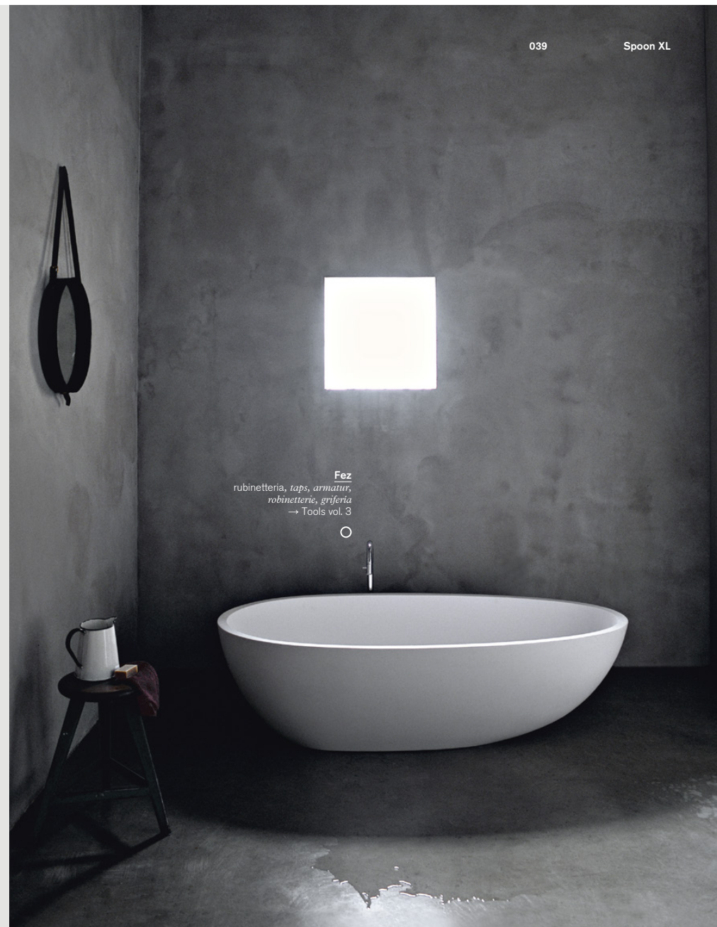
Fez rubinetteria, taps, armatur, robinetterie, grifería → Tools vol. 3