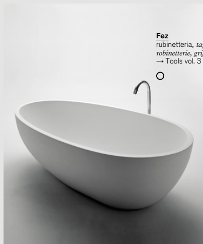
Fez rubinetteria, taps, armatur, robinetterie, grifería → Tools vol. 3

Comparada con la bañera Spoon, el vaso del modelo Spoon XL es más profundo y su diseño más minimalista. Se ambienta fácilmente en los contextos más variados, Spoon XL está realizada en Cristalplant® biobased blanco, un material cálido y agradable al tacto.